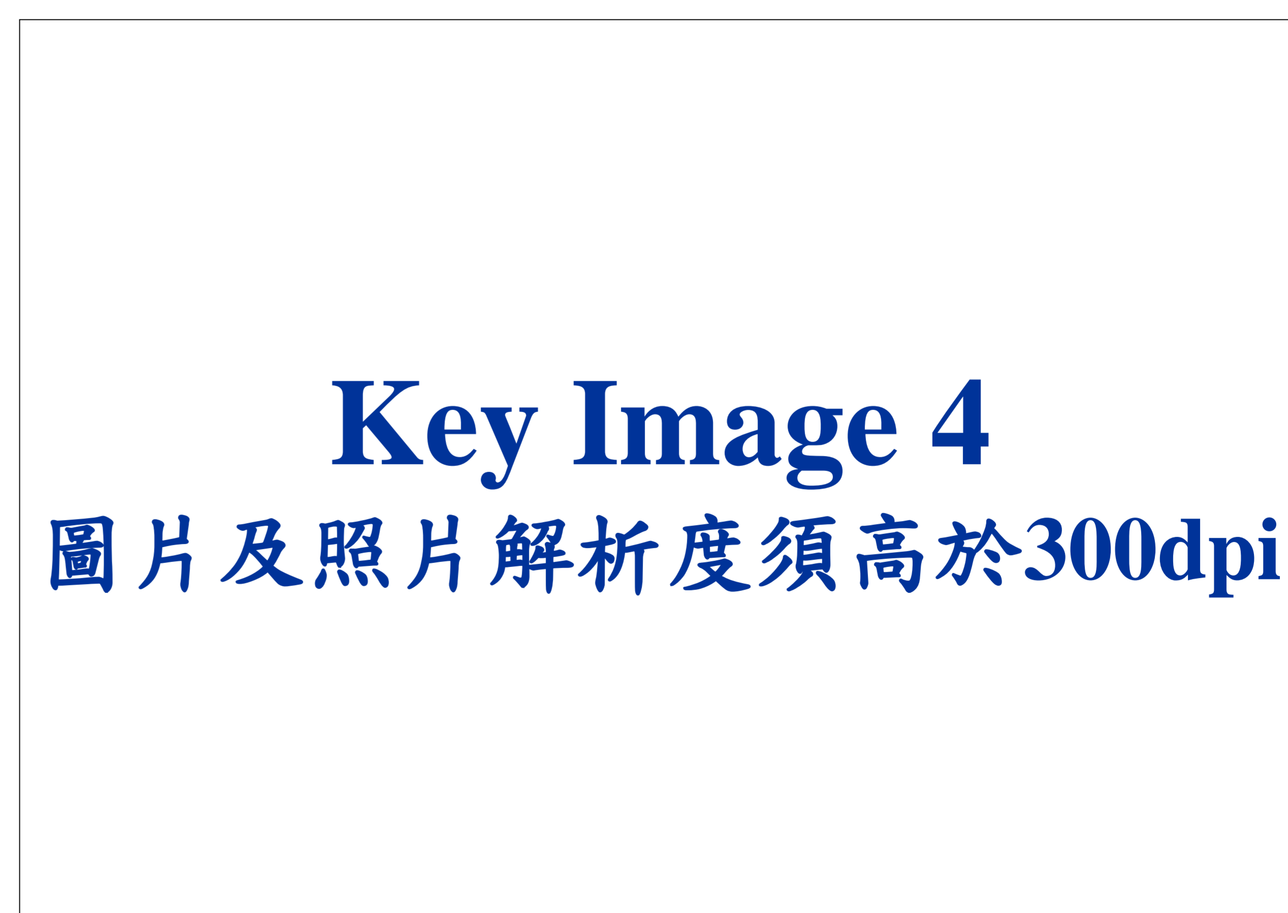
Figure 4. Caption in Times New Roman, 20 points, bold.