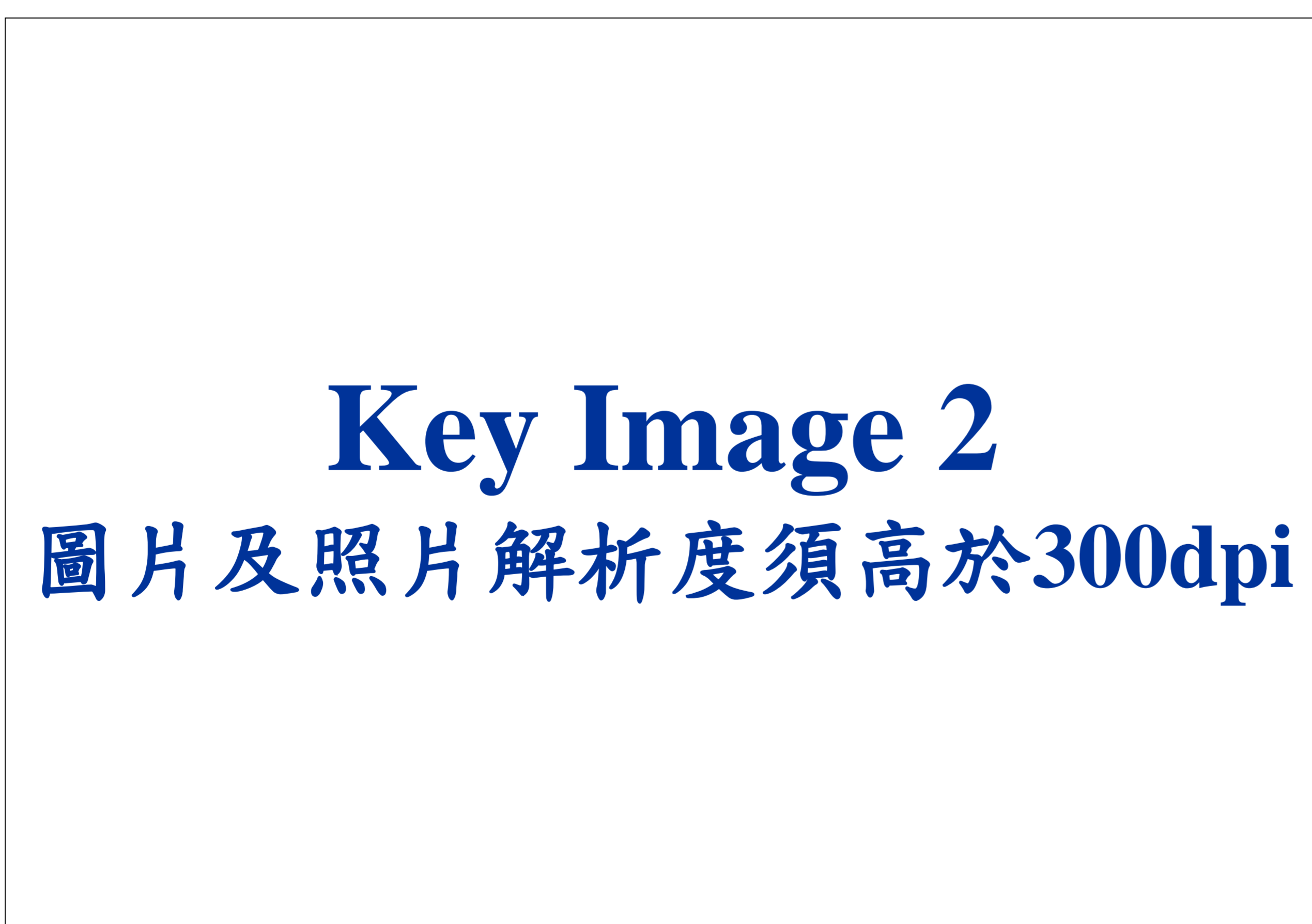
Figure 2. Caption in Times New Roman, 20 points, bold.

Text in 標楷體, Times New Roman, 24 points, Bold. Text in Times New Roman, 24 points, Bold. Text in Times New Roman, 24 points, Bold. Text in Times New Roman, 24 points, Bold. Text in Times New Roman, 24 points, Bold. Text in Times New Roman, 24 points, Bold. Text in Times New Roman, 24 points, Bold. Text in Times New Roman, 24 points, Bold. Text in Times New Roman, 24 points, Bold. Text in Times New Roman, 24 points, Bold. Text in Times New Roman, 24 points, Bold.