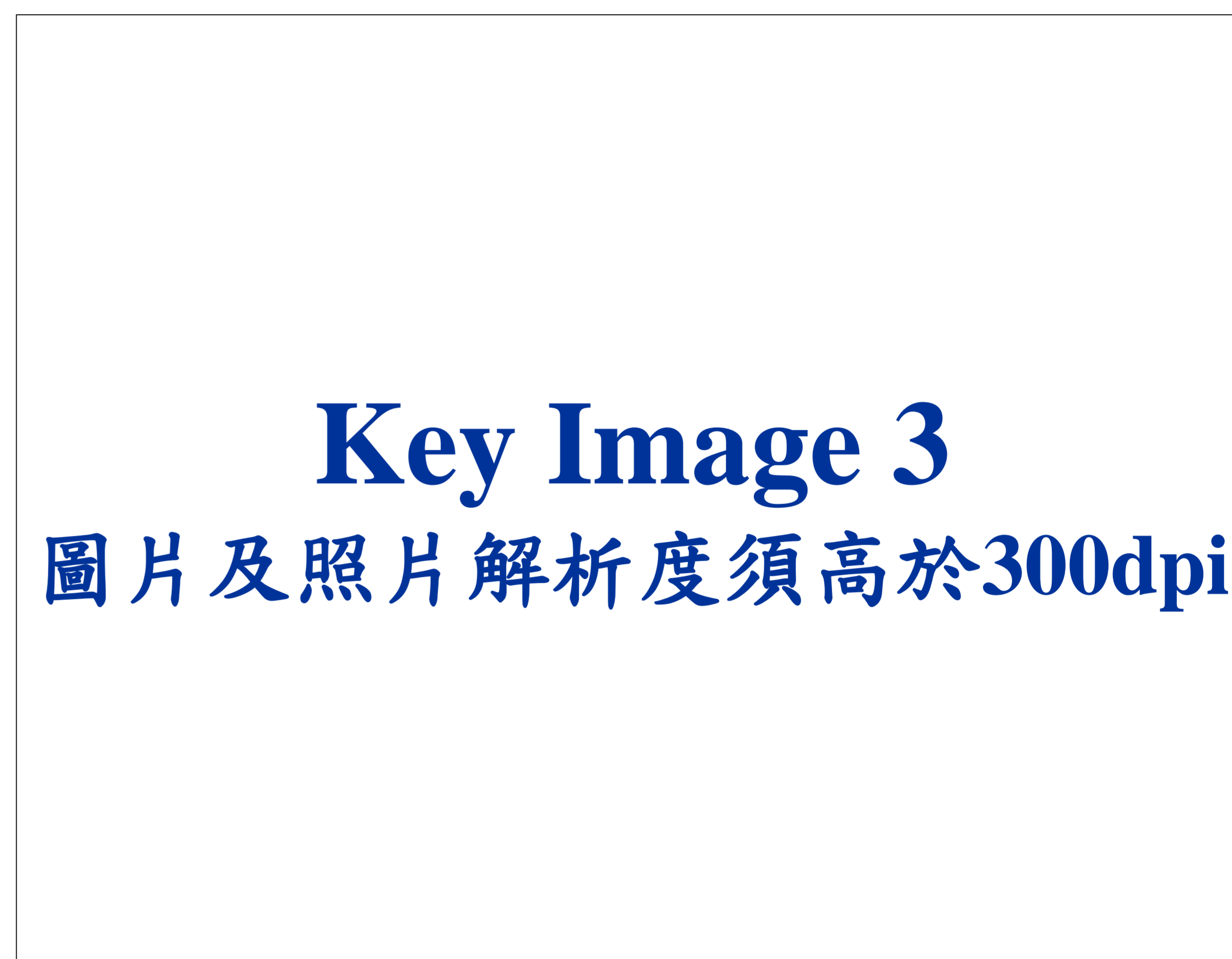
Figure 3. Caption in Times New Roman, 20 points, bold.